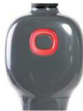
Vitesse trop lente