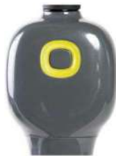
Vitesse trop rapide