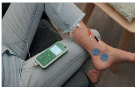
Electrostimulation du NTP (Nerf Tibial Postérieur) dans le cadre de l'hyperactivité vésicale